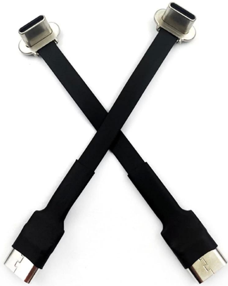
USB A naar 90 graden USB-C FPC platte lintkabel