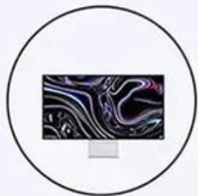
Pro Display XDR