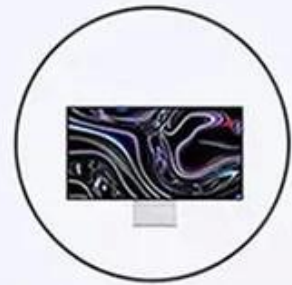
Pro Display XDR