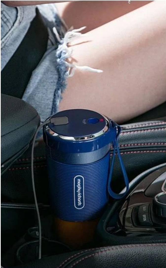
Magnetic smart watch charger Support charging in multiple scenarios